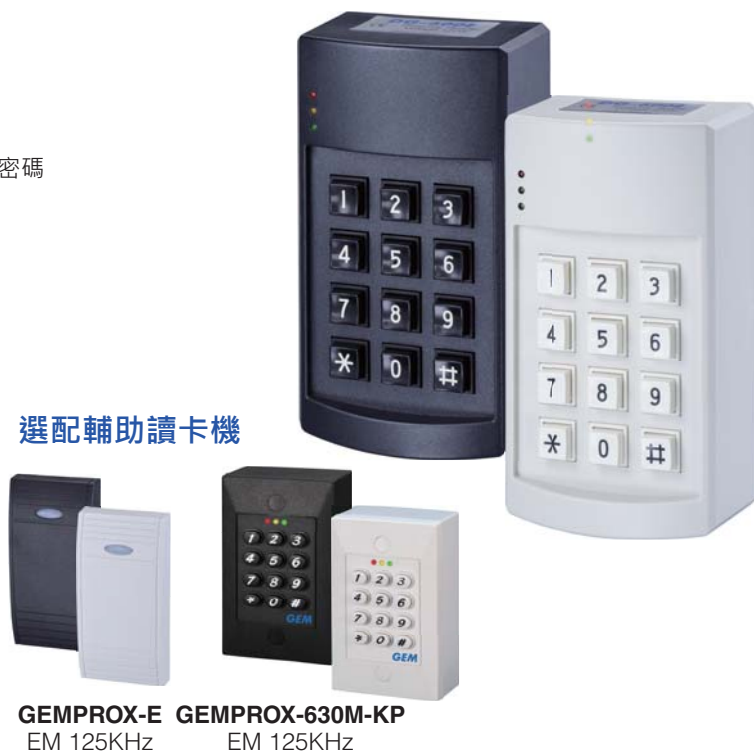
GEMPROX-E EM 125KHz GEMPROX-630M-KP EM 125KHz