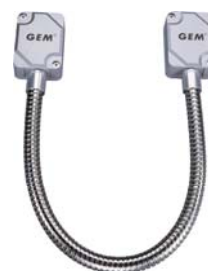
DL-360TB 不銹鋼電源保護管 (附可拆式端子台)