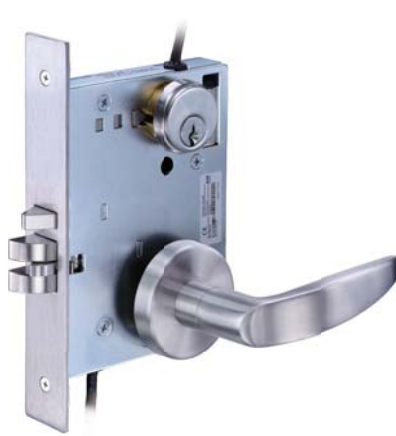
GEM880電子機械鎖匣 + 型號 L812 把手組