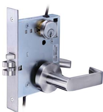
GEM880電子機械鎖匣 + 型號L811把手組