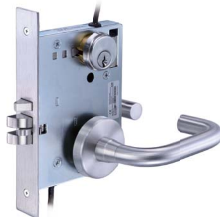
GEM880電子機械鎖匣 + 型號 L814 把手組