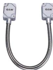
DL-360TB 不銹鋼電源保護管 (附可拆式端子台)